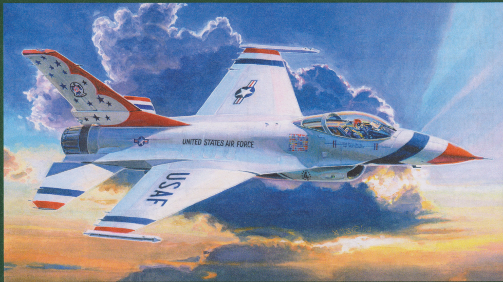
ART BY ADAM MARGINIAK